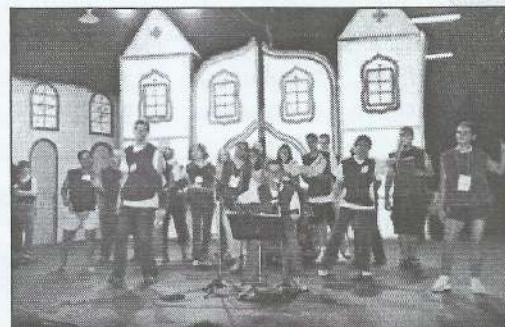
Abertura do EECDDME