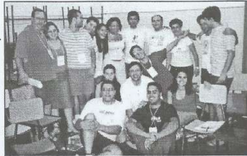
Confraternização dos participantes em sala