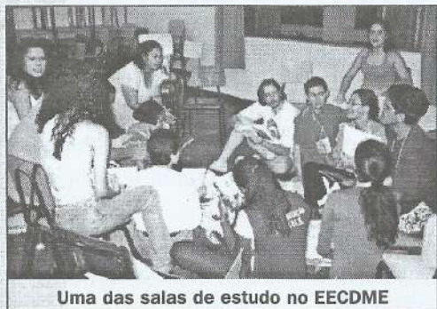
Uma das salas de estudo no EECDDME

Participaram 130 jovens, representantes de 53 Mocidades