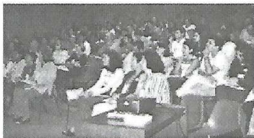
Participantes do DIJ de todos os estados brasileiros.