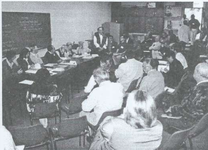
Aspecto da reunião do CDE

Com um bom número de representantes dos órgãos da USE de todo o Estado de São Paulo, realizaram-se as reuniões do Conselho Deliberativo Estadual (CDE) e do Conselho de Administração (CA), em clima de fraternidade e trabalho.