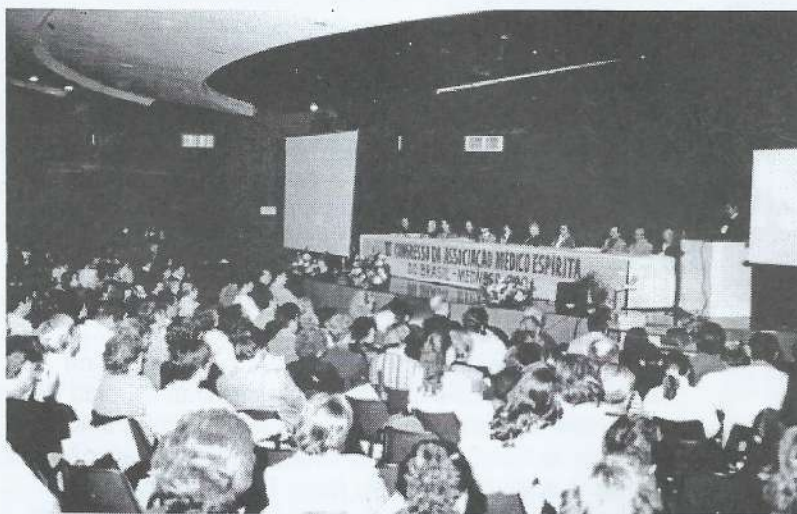
Aspecto da abertura do evento, com o auditório Ellis Regina lotado