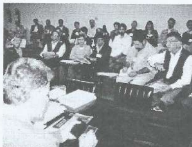
Aspecto da reunião do CDE

Foi aprovado também o tema central do 12º Congresso Espírita Estadual da USE que se realizará em 2003: "Movimento Espírita - Novos Horizontes" . Foi deliberado também que a próxima visita da D.E da USE será no dia 07 de julho de 2001, na região Leste 2, na cidade de São José dos Campos. Aprovou-se a formação da Comissão em conjunto com o CA para avaliação da questão das anuidades das Socie-