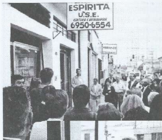
Em frente a sede da USE estadual os representantes dos órgãos da USE se reúnem para a reinauguração da Livraria