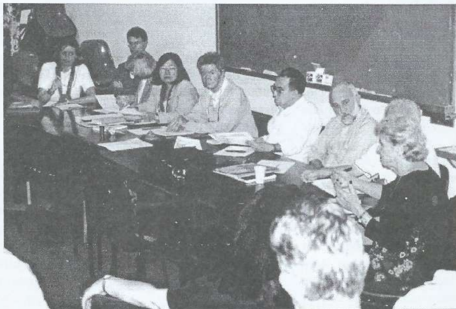
Mesa Diretora da Reunião do Conselho de Administração

A Diretoria Executiva fez breve relação sobre as reuniões setoriais realizadas em