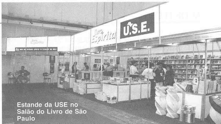
Estande da USE no Salão do Livro de São Paulo

A USE Distrital do Tucuruvi, USE Distrital de Santana e o Conselho Norte II da FE-ESP promoveram no dia 7 de