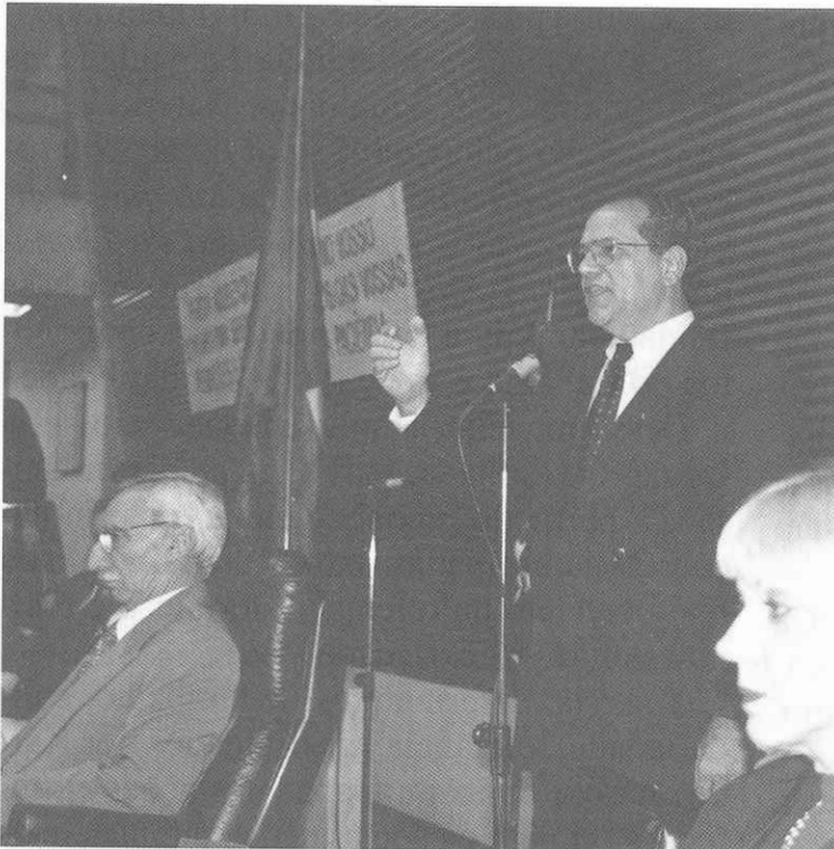
O presidente Perri lembrou os grandes feitos espíritas, na sessão especial da Assembléia Legislativa que comemorou o dia dos espíritas

O Dia dos Espíritas foi comemorado em sessão solene no dia 16 de abril último, no Plenário Juscelino Kubitschek da Assembléia Legislativa de São Paulo. O início foi às 20 horas, sob a presidência do Deputado Alberto Calvo, autor do projeto que instituiu o "Dia dos Espíritas".